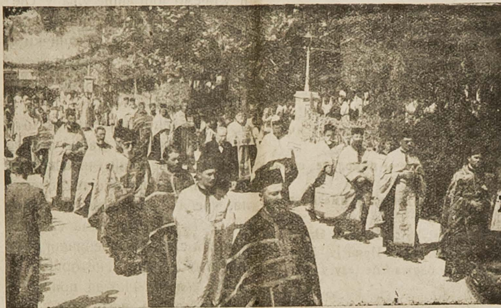
Свештенство у литији послје дочека

Срећни смо, Светости, ради толике несобитне указане нам пажње, којом највидније испољујете своју превелику очинску љубав и старане за нас свију пак благодарити Вам од срца још једном на овој првој Вашој високој, а нама тако драгој и милој посјети, кличемо најискреније Вашој Светости као и Њиховим Преосвештенствима који су у Вашој веома цијењеној и врло уваженој пратњи „Добро нам сви дошли и живјели“, те молимо за Ваш Патријаршки благослов.