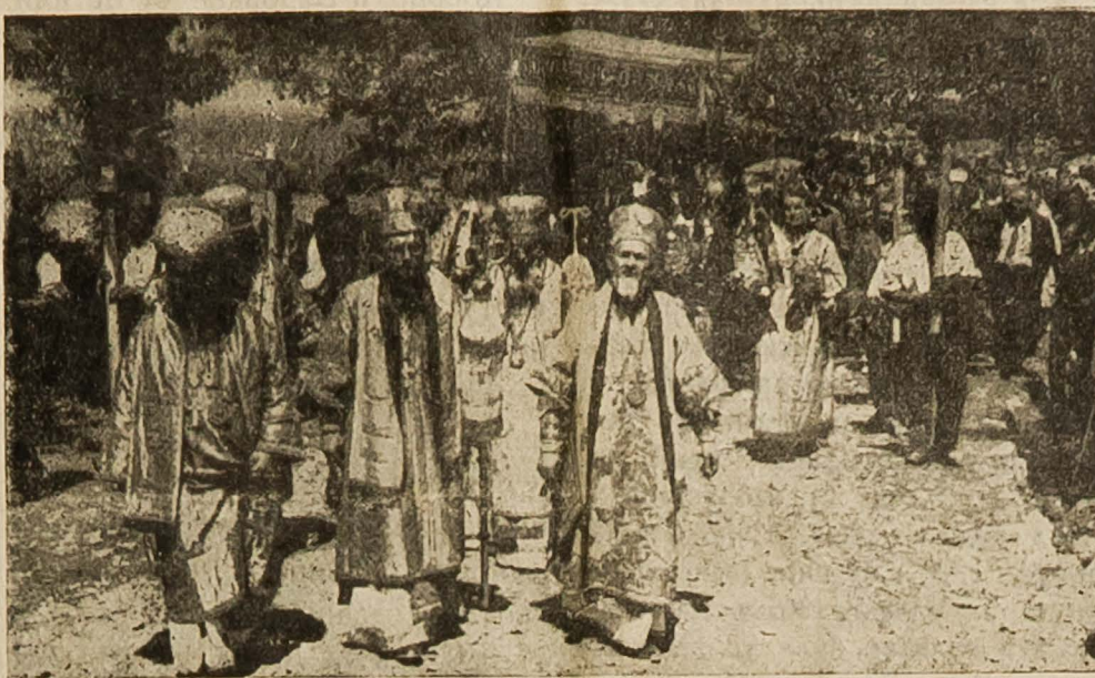
Г. Г. Архиепископи у литији Видовданској на Косову.

свој израз код нашег народа у овом дијелу Отаџбине. дао је нико мање признање до Патријарх Српски, Први чувар православног духа на свијету. Он је дошао у свој народ, да се са њим заједно помоли Богу за душе ових, који ствараше и створише уз помоћ Божју данашњу Југославију. Заиста риједак примјер сатисфакције народу једном, који је много дао, много претрпџо и много вјеровао. Са зеленилом окићеној