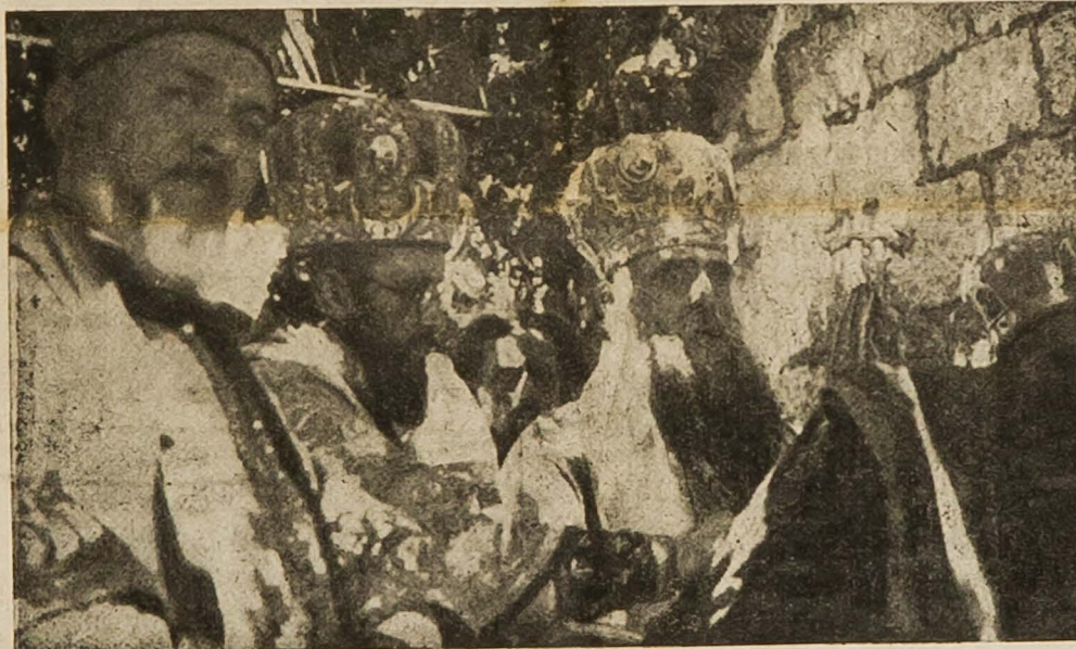
Његова Светост говори на помену на Далм. Косову

Други такав Видовдан, Видовдан који се не повраћа и не понавља, био је наш Видовдан 1921 године; онда када се ис-