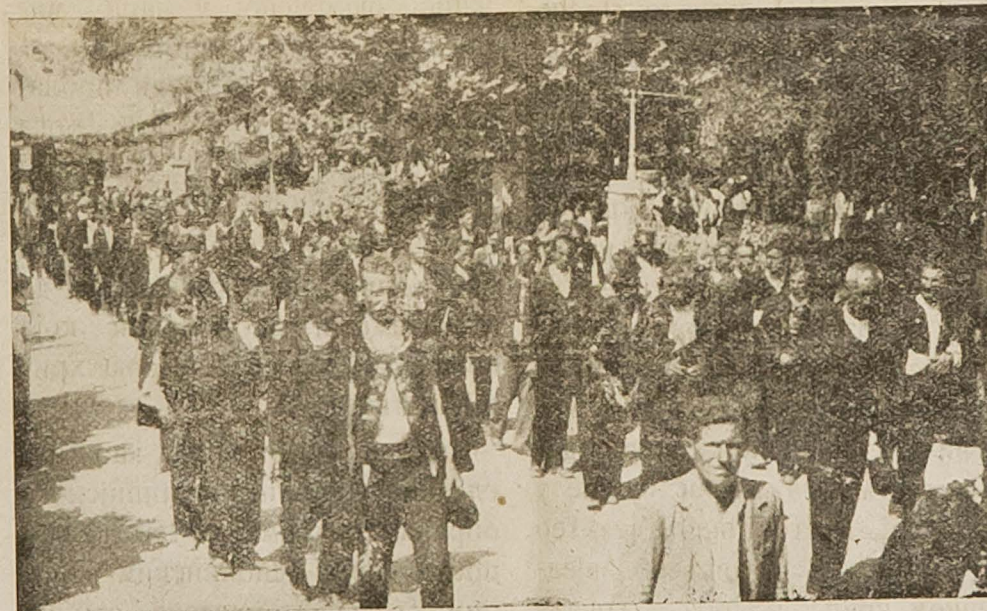
Група представника црквених општина у литији у Шибенику