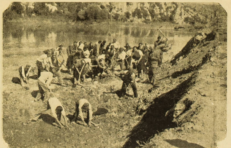
Omladina na radu na Bilušića Buku

U ime Narodnog fronta Vodice govo- rio je Miše Dunat: »Omladinci i omla- dinke, želim vam svaku sreću i napredak u vašem plemenitom nastojanju na šire- nju ljubavi i međusobnog razumijeva- nja među našim narodima, koji su danas okupljeni u jedinstvenom Naro- dnom frontu pod vodstvom našeg ljublj- nog maršala Tita. Jedinstveni Narodni front nije jedna privremena koalicija, već jedan dugi i čvrsti savez, koji je vo- dio i koji će voditi Srbe, Hrvate, Slo- vence, Makedonce i Crnogorce sreći i napretku. Narodni front odigrao je ve- liku ulogu za vrijeme oslobodilačkoga