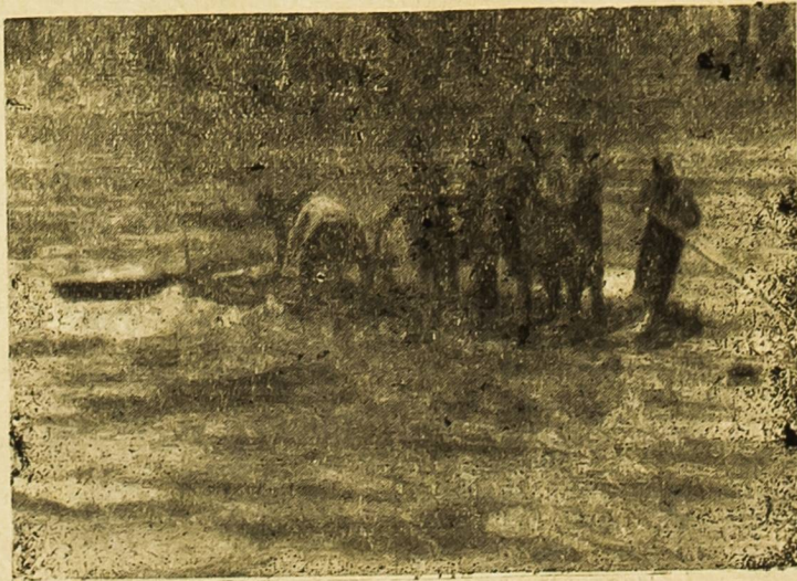
II. Dalmatinska prela ž Drinu (V. ofenziva)

Omladina vođičkog kotara također čini velike napore da ne zaostane u radu od omladine drugih kotara našeg okruga. Pored rada na sječi drva u Velebitu i na Čavlinovom