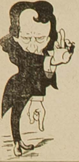
Glavonja kao oznaka dućana