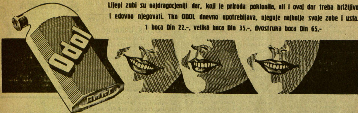
Odol se dobiva u svim ljekarnama, drogerijama, parfumerijama i usjecajnim trgovinama.

Lijepi zubi su najdragocjeniji dar, koji je priroda poklonila, ali i ovaj dar treba brizljivo i edovno njegovati. Tko ODOL dnevno upotrebljava, njeguje najbolje svoje zube i usta.