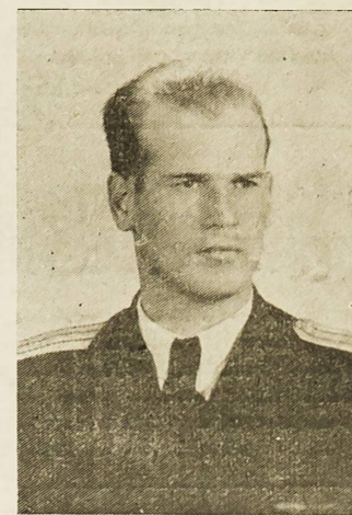
Narodni heroj Mate Staničić

mogli kretati cestom, jer smo je ranije nekoliko dana proko-pali i postavili barikade, već su izabrali pravac koji vodi izme-du druge i prve čete II. bataljo-na. Namjera je neprijatelja bila da izbjije pozadi prve i treće čete i da na taj način opkoli i uništi čitav naš bataljon. U napadu je učestvovalo šest tenkova, koji su se sporo kretali po prilično str-mom zemljištu. Oni su iz pokreta obasipali naše položaje mitra-ljeskom i topovskom vatrom. Tenkovi su napredovali do pe-deset metara. Naši borci momen-talno su usmjerili svu vatra na tenkove. U ovim trenucima borci i rukovodioci bili su odluč-ni da provedu u djelo naređenje štaba brigade — ovuda u Livno ne smiju proći. Zbog nedostatka municije naša vatra je oslabila, što je neprijatelj i osjetio, i ten-kovi su krenuli dalje. Još par desetina metara i onda se odva-jaju. Tri produžuju u napad, a ostali tenkovi ostaju da vatrom štite njihov pokret. Tenkovi su se približili našem položaju do na pedeset metara. Borci su ima-li dobre zaklone i vatra iz tenko-va nije mogla ništa napraviti. U jeku borbe jedan od tenkova se odvojio u namjeri da izbjie na bok naših položaja. Situacija