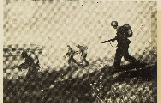
Sa posljednjih manevara JNA

U takvoj armiji neophodan je dalekosežan rad i on se kod nas (Nastavak na 2. strani)