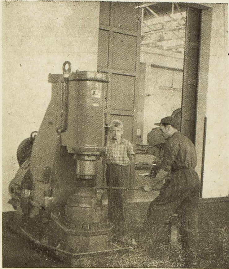
Iz TLM »Boris Kidrič«

U članstvu Saveza sindikata Jugoslavije žene sačinjavaju 26 posto, a u biranim sindikalnim organima 17,5 posto.