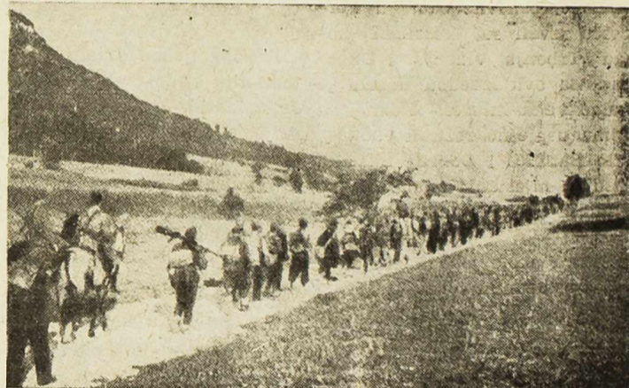
Partizanska kolona u pokretu

U diskusiji je Šutina Jerko govorio o radu organizacije u Zlaturinu, a Vujo Đurica je istakao da se u nekim selima ne vodi dovoljna briga o uređenju grobova palih boraca, kao i i prijenosu posmrtnih ostataka palih drugova u zajedničku kosturnicu. Naglasio je potrebu da se u selima pokloni veća pažnja za uključivanje u organizacije Saveza boraca onih lica, koja imaju sve uslove da budu članovi te orga-