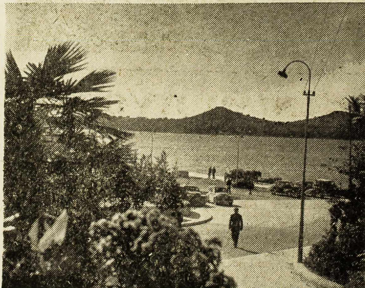
Motiv iz Šibenika

MIJENJAM SVOSOBNI STAN sa nuzprostoriama u Ulici Bratstva i jedinstva 13 za trosobni stan tkođer u Šibeniku. Za informacije upitati u »Modnom magazinu« — Šibenik.