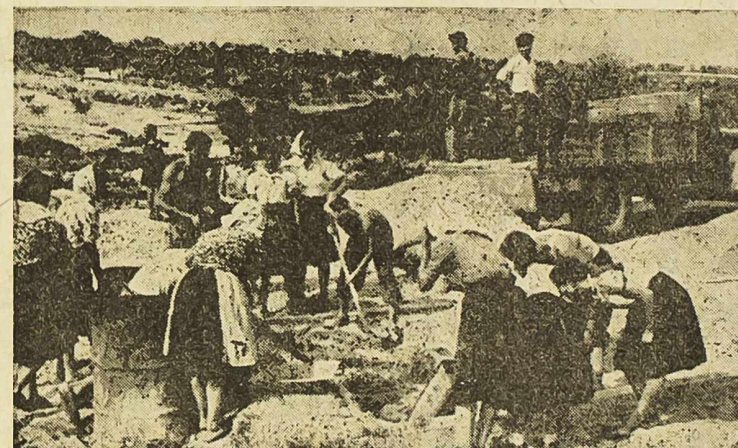
Južni Primošten — Dobrovoljni rad na izgradnji škole

Na odvojenim sjednicama donijeto je rješenje o konstituiranju tvornice vijaka, koja će uskoro biti puštena u normalni pogon. Naglašeno je, da se do kraja ove godine u tvornici izaberu organi upravljanja odnosno radnički savjet i upravni odbor.