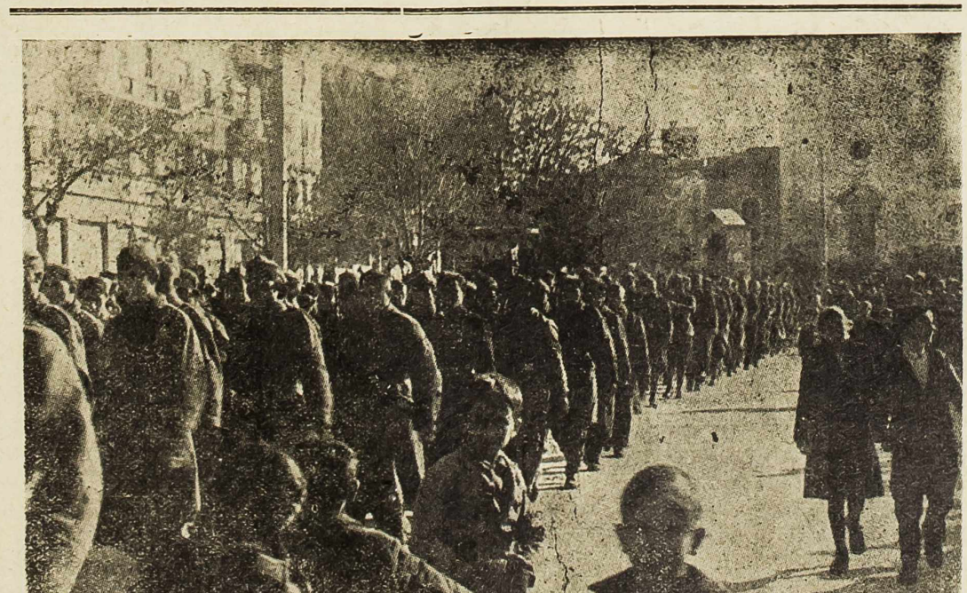
I. dalmatinska proleterska brigada u oslobođenom Šibeniku

Prisutni rukovodioci obje zemlje bili su oduševljeni solidnim izvođenjem bogatog repertoara.