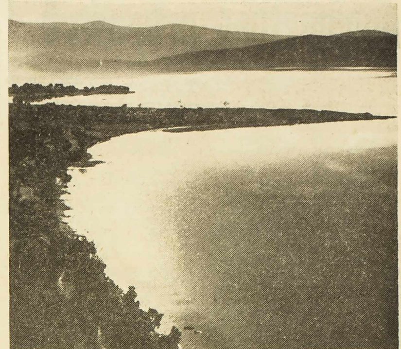
Ova je slika snimljena sa nove trase magistrale, na dionici Šibenik — Grebaštica. Na njoj vidimo jednu od najljepših prirodnih uvala sa pjeskovitim plažom na šibenskoj rivijeri. Možemo slobodno kazati, da je ravna onoj na Slanica otoku Murteru. Za sada je ona pusta i neuređena, ali su upravo u pripremi planovi i elaborati, koji će imati prioritetni karakter, što znači, da će se uređenju ovog područja pristupiti što je moguće prije i približiti ga turistima, koji će ga s užtkom koristiti.