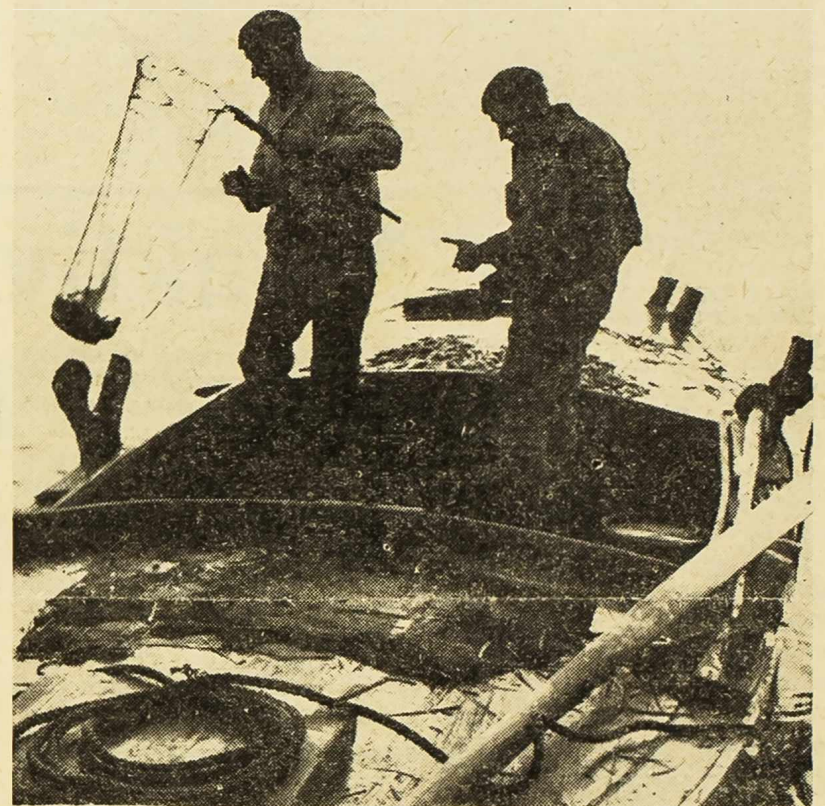
Šibensko područje, ako se izuzmu Kornati, nije bogato ribom. Međutim, na pojedinim mjestima između Krpana i Primoštena, nalaze se brojne uvale s dubokim i bistrim morem, koje su bogate krupnom bijelom ribom. Za sada tu love samo ribari iz okolice, ali može se očekivati, da će se ovdje, pored ostalog, razviti i ribolovni turizam, koji će donositi korist i biti isto toliko poznat kao, na primjer, zmski lov na zečeve na drugoj strani šibenskog kanala. J. C.