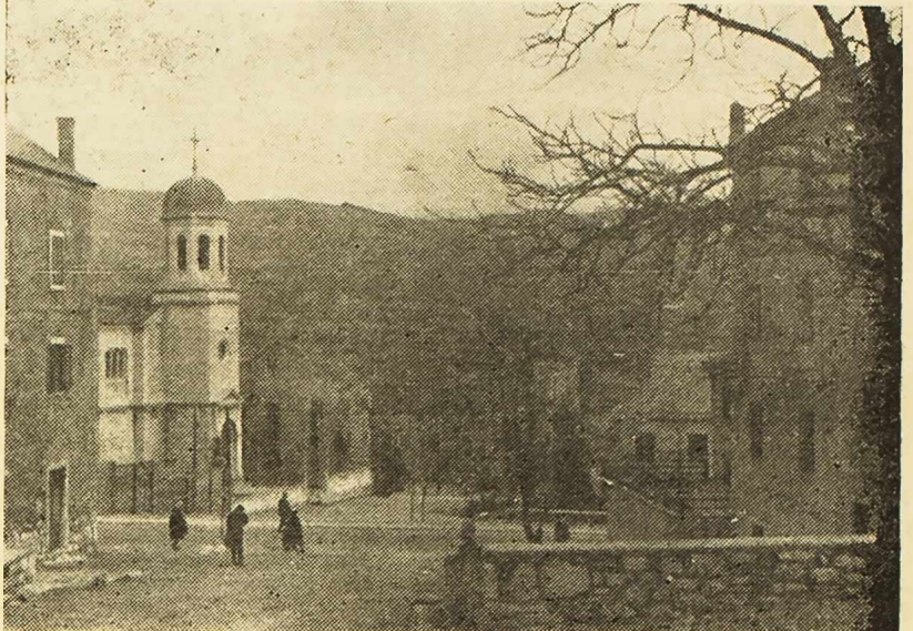
Drniš Iz „Dalmacija-plastike“ u Drnišu

Izvršni odbor Općinskog odbora SSRN je na osnovu ovih zaključaka dao preporuke zainteresiranim organizacijama i ustanovama.