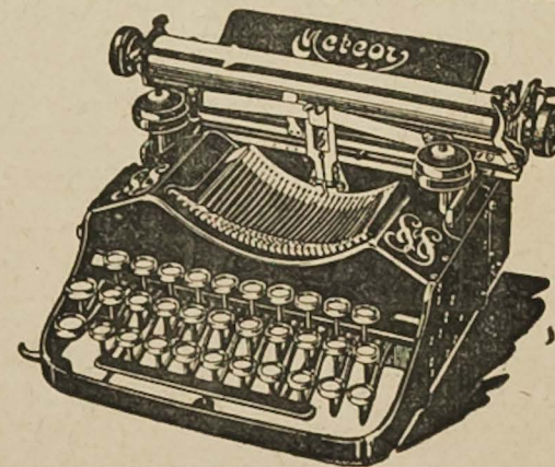
Disači stroj «Meteor» takogjer hrv. pismom.

POTPLATE od gume i od kože za postole, samo za trgovce i postolare na veliko.