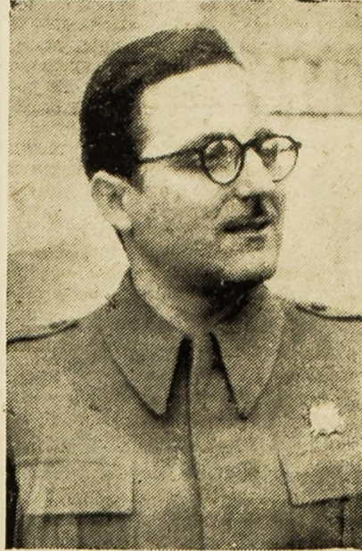
ДУШАН БРКИЋ министар правосуђа

челу антихитлеровске коалиције. (Аплауз). Ми у овом периоду и у овом моменту одајемо признање великом вођи и стратегу маршалу Сталину, који води правилним путем Совјетски Савез и указује свим поробљеним народима којим путем треба да се иде. (Аплауз. Појави се Жи-