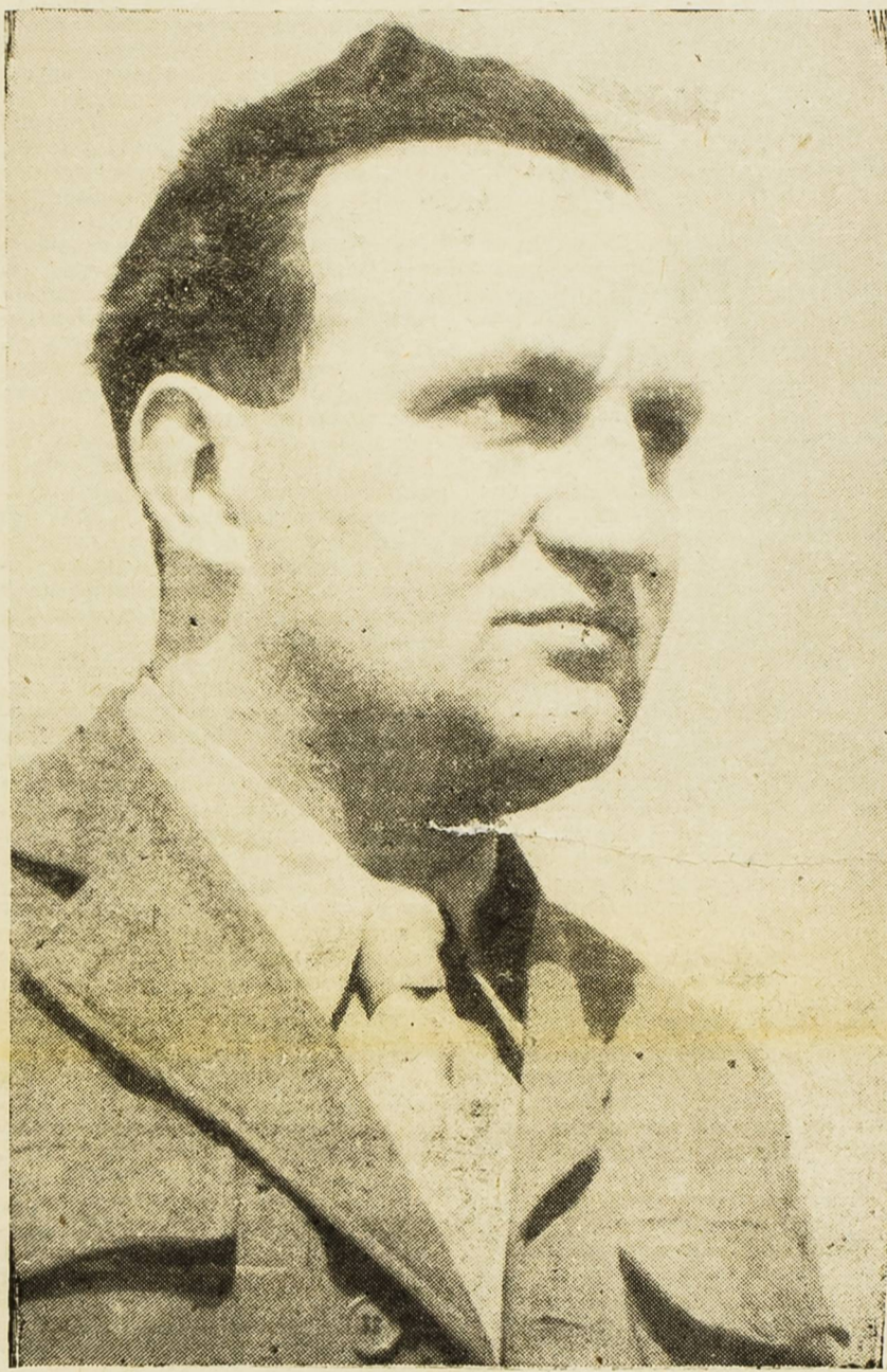
ДР. ВЛАДИМИР БАКАРИЋ, претседник Народне владе Хрватске